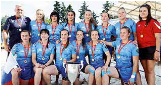
«Дебют года» — Женская сборная России по пляжному регби