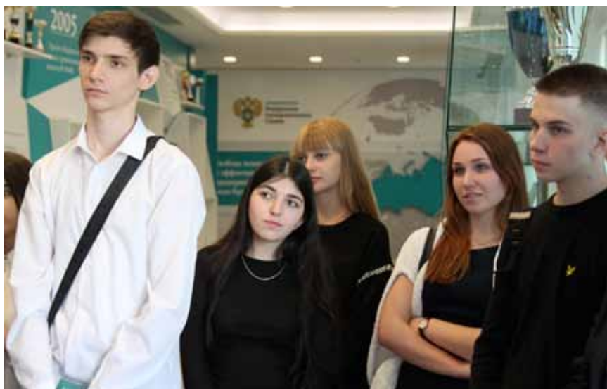
Старшеклассникам экскурсия в ФАС России помогает понять законы конкуренции

В соответствии с поручением Президента РФ ФАС России разработало и представило на публичное обсуждение три законопроекта, которые смогут оптимизировать