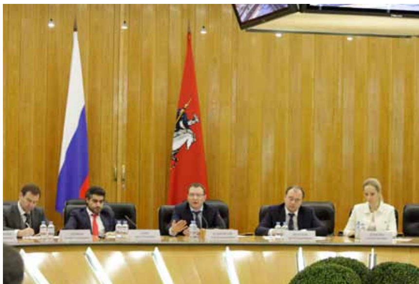
Публичные слушания по правоприменительной практике ФАС России и Московского УФАС России в Правительстве Москвы.