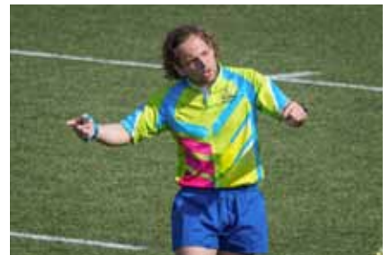
«Арбитр года» — Георгий Копп