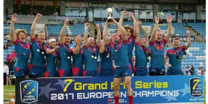
Сборная России по регби-7