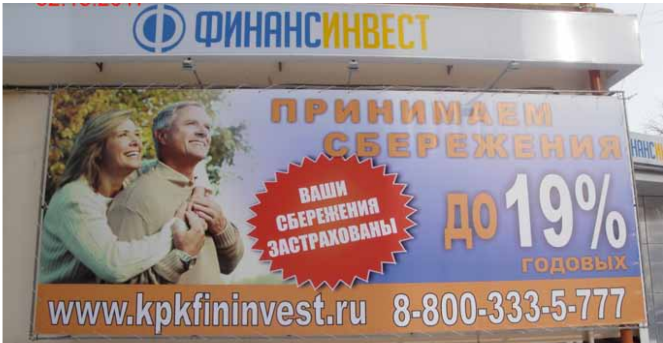
Здесь нарушения ч.1 ст.28, ч.7 ст. 5, п.2 ч.2 ст.28, ч.3 ст.28 Закона «О рекламе»!

➤ С начала XXI века реклама перестала быть просто «двигателем торговли». Она стала частью жизни людей, определяя не только решение о покупке, но и стиль жизни, манеру поведения, характер отношений. С развитием IT-технологий рекламные призывы и образы буквально окутали жизнь человека и проникли во все информационные носители. Нередко рекламу относят к элементам культуры, но ведь от этого она не перестала быть рекламой. Соответственно, не вышла из-под контроля Феде-