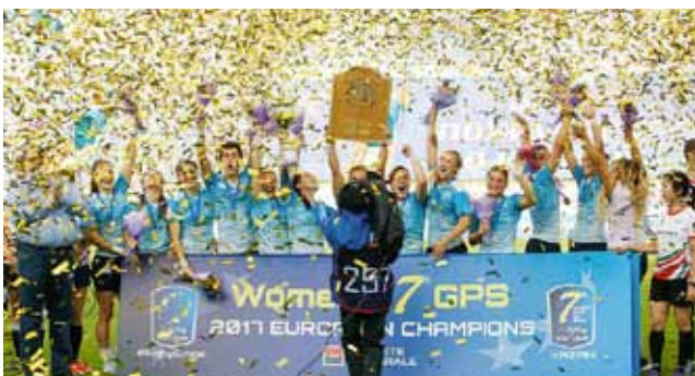
«Команда года» — сборная России по регби-7