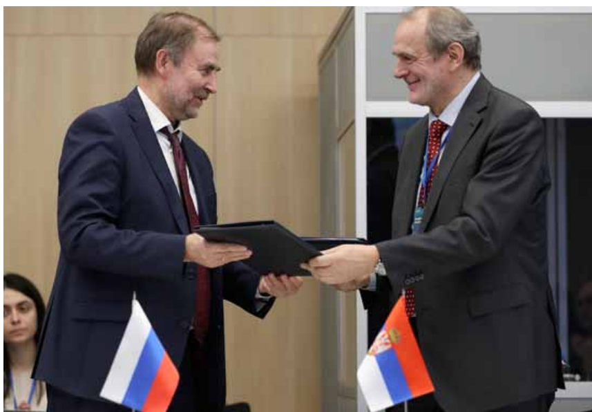
Подписание Меморандума о взаимопонимании в области тарифного регулирования электронной связи и почтовых услуг между ФАС России и Агентством по регулированию электронной связи и почтовых услуг Республики Сербия

Подготовлено Управлением общественных связей ФАС России