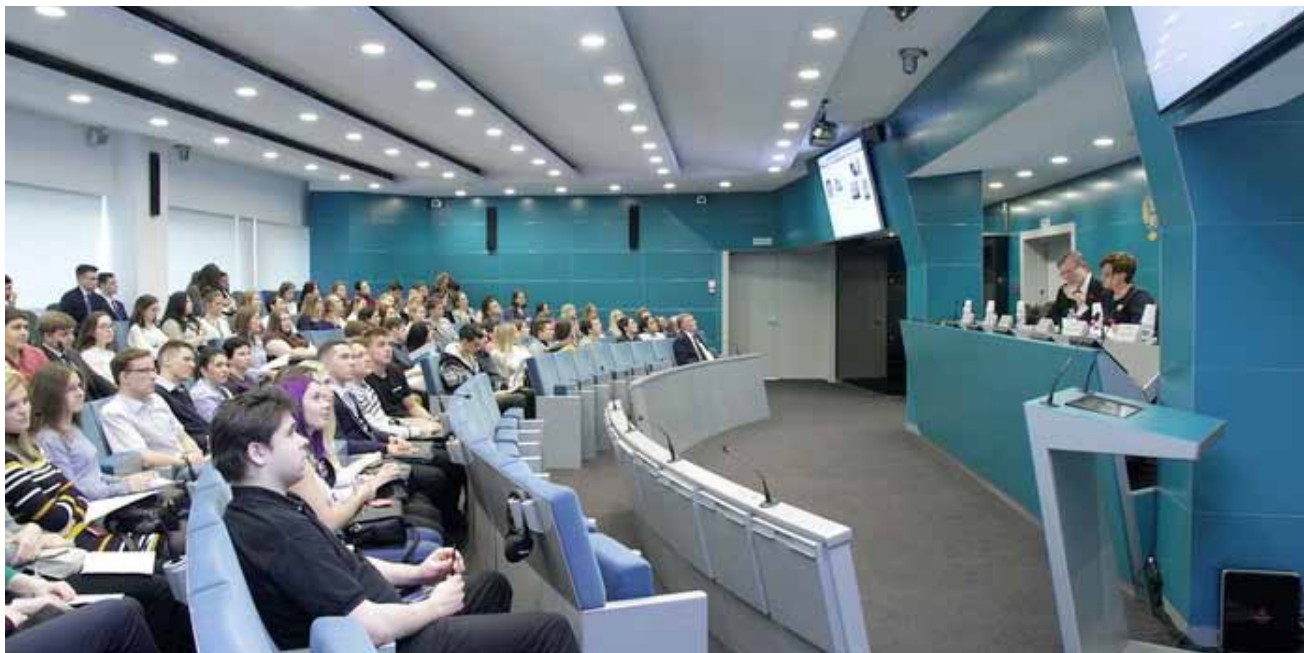
День открытых дверей в ФАС России для студентов московских вузов

других органов государственной власти и управления, общественных объединений предпринимателей, средств массовой информации. Мероприятия проходят в различных форматах и составах участников, вызывают большой интерес со стороны руководителей предприятий, предпринимателей. Так, публичные обсуждения правоприменительной практики ФАС России и Московского УФАС России по итогам 3 кварталов 2017 года 8 прошли 1 декабря в Правительстве Москвы. Со вступительным словом к участникам публичных обсуждений обратился заместитель руководителя ФАС России Сергей Пузыревский. Он рассказал, что Федеральная антимонопольная служба в числе 12 надзорных органов является участником реформы контрольно-надзорной деятельности. Реформа предусматривает как изменение законодательства, так и изменение подходов к контрольным и надзорным процедурам. «ФАС России является активным участником проекта и отмечает, что новая система госконтроля позволит снизить административную нагрузку