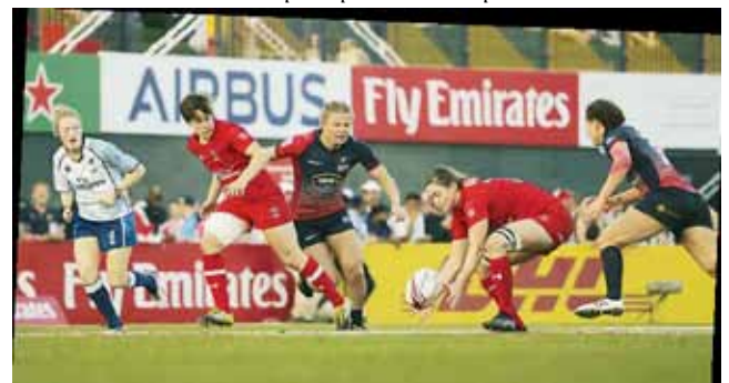
Сборная России по регби-7 в игре