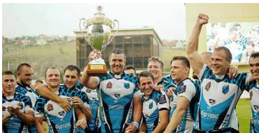
«Команда года» — «Енисей-СТМ»