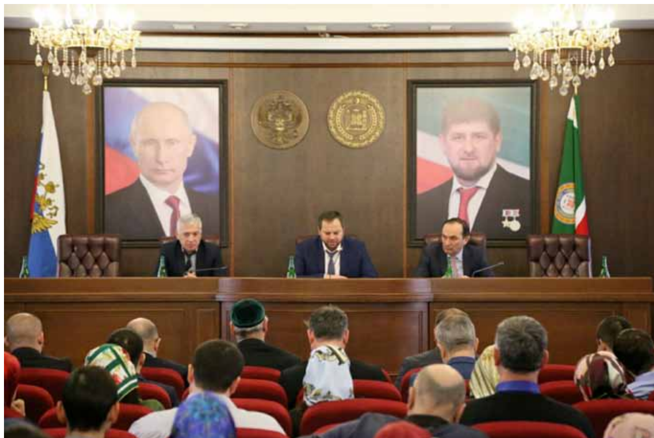
Публичные обсуждения правоприменительной практики Чеченского УФАС России

и восстанавливать конкуренцию на рынке. Такой механизм хорошо зарекомендовал себя, компании зачастую добровольно устраняют нарушения, чаще всего допущенные непреднамеренно», – уточнил замглавы ФАС России.