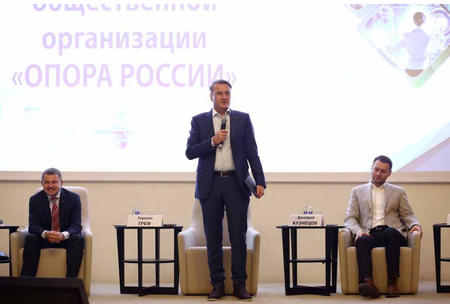
Дискуссию открывает Председатель Правления ПАО «Сбербанк» Герман Греф

Искусственный интеллект уже активно используется в российских банках